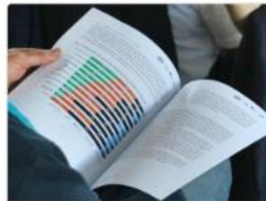
Analyse der Jugendumfrage der Region Kerzers