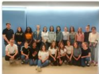
Kurzversion engage-Atelier St.Gallen