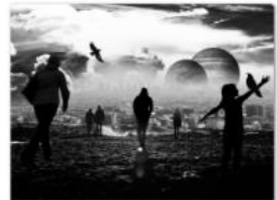
Schulklassen für Science and You(th) BERN gesucht!