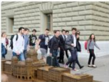
Die ausgewählten Anliegen von «Verändere die